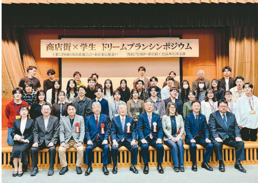
笑顔で記念撮影に臨む学生と関係者