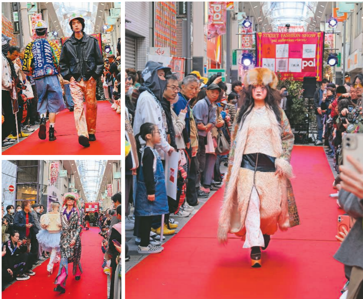
すべて古着の独特なコーディネートでランウエーを歩くモデルたち

モデルが、商店街に加盟する古着店の取り扱った商品によるスタイリングでさっそうとランウエーを歩くさまは、ウエーを歩くさまは、その趣旨に沿った「ストリート系」や「モダン系」「ガーリー系」「和服」など、さまざまなファッションが披露された。高円寺パルは、今年で2回目。まつの目玉は、約100店舗が並ぶアーケード商店街をランウエーに見立てたファッションショー。プロのモデルが、商店街に加盟する古着店の取り扱った商品によるスタイリングでさっそうとランウエーを歩くさまは、ウエーを歩くさまは、その趣旨に沿った「ストリート系」や「モダン系」「ガーリー系」「和服」など、さまざまなファッションが披露された。