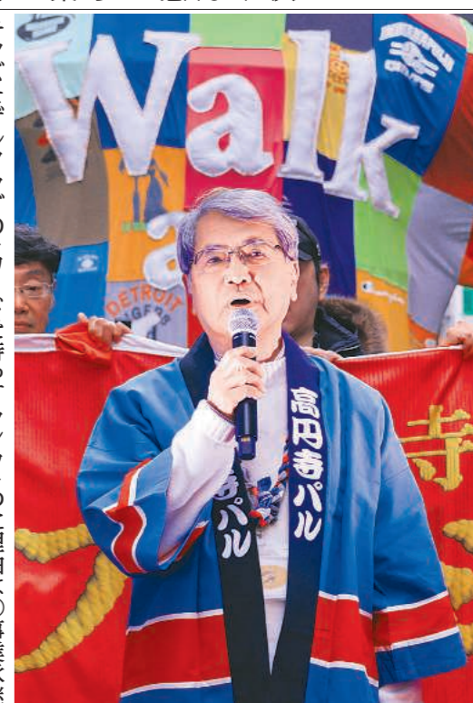
高円寺パル商店街をファッション特区に宣言した河原理事長。ショーの後はパルで買い物を楽しんだりして楽しんで、と呼びかけた。