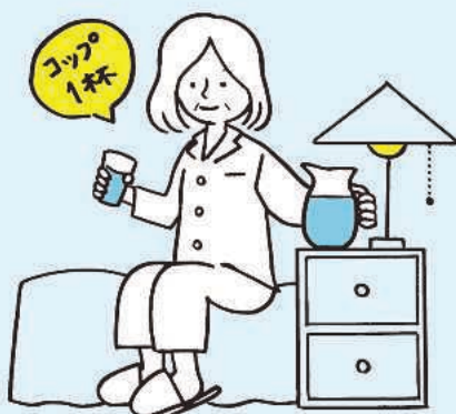
就寝時にも水分摂取