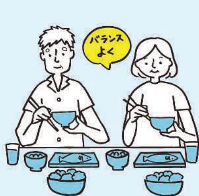
十分な睡眠と バランスの良い食事を心がける