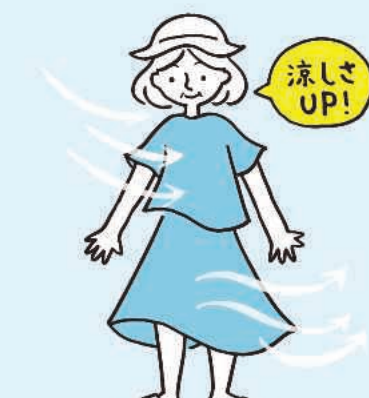
吸湿性・速乾性のある 通気性の良い服も効果的