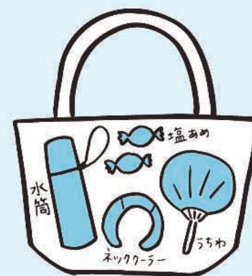
外出でも水+塩分 ※塩分については既往症のある方はかかりつけ医に要相談