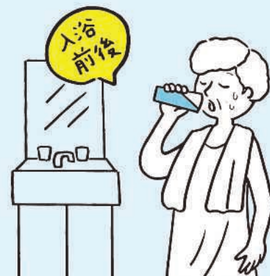
入浴前後に水分補給