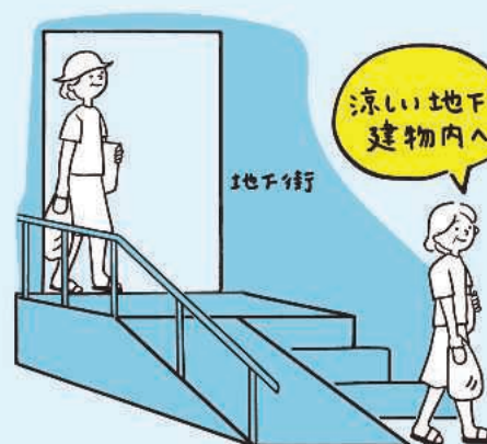
歩く時は地下道や建物内部を利用