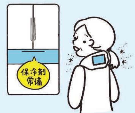
いざという時のために保冷剤を常備