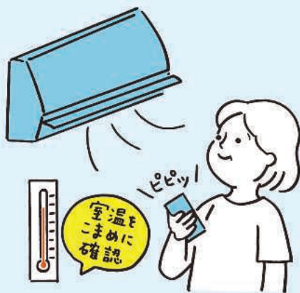
エアコンや扇風機で室温をこまめに調節