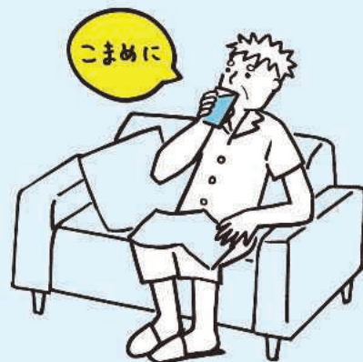
室内でも水分摂取