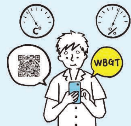
暑さ指数 (WBGT) を毎朝確認