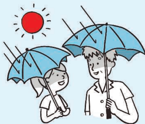
老若男女問わず日傘を使用