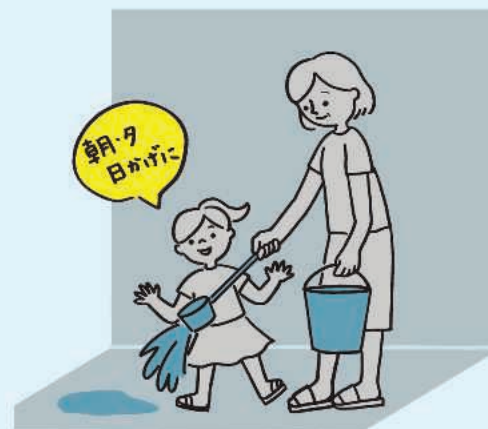
打ち水は朝夕、日陰に撒くことで効果が持続