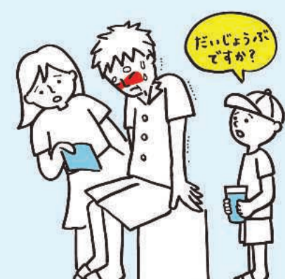
周りの人の声かけ