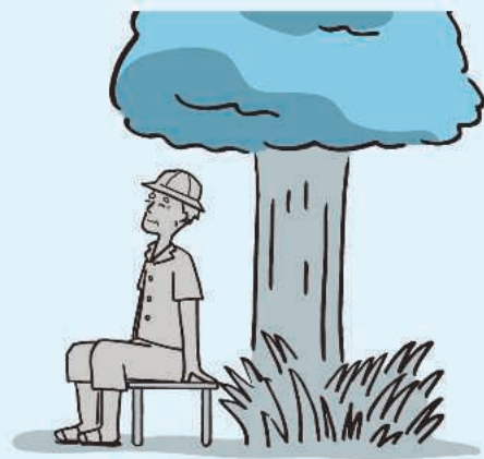
こまめに日陰で休憩